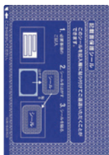
記載面保護シール

同封の「株主優待カタログ」より商品をお選びいただき、「株主優待商品申込ハガキ」に必要事項をご記入の上、ご返送下さい。(申込期限：平成31年5月31日消印有効)