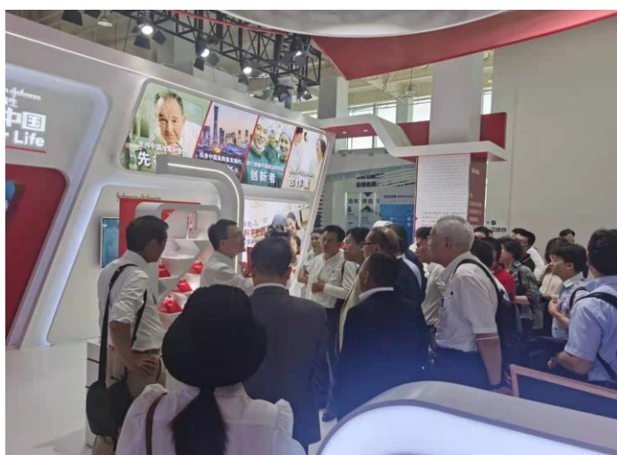
日中海南島視察団が現地視察の様子

6月28日（月）から30日（水）までの3日間、ラオックスをはじめ、日中の有名企業42社からなる海南視察団が海南島に到着、一行は一堂に会して海南国際経済発展局を訪れ、海南島の離島免税や越境ECビジネスの急速な発展と、海南自由貿易港における様々な政策の支援に注目、海南自由貿易港の越境や金融開放政策、ラオックスグループのサプライチェーン及び海南免税店開設計画、中日免税事業海南促進会の設立などについて活発な意見交換を行いました。