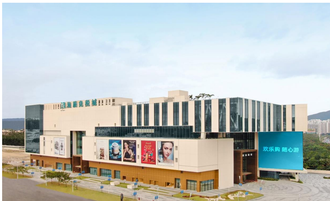
海南省三亚市に位置する海旅免税モール

にいながらにして免税で買い物ができる地域は、中国全土の中では香港と海南島のみです。新型コロナウイルスによる影響で海外旅行に行けない状況が続く中、海南島への免税品ショッピングを目的とした中国人の国内旅行人気はさらに高まりを見せています。