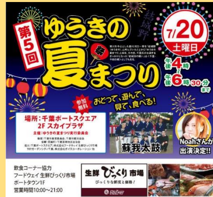
第五届结城野夏祭