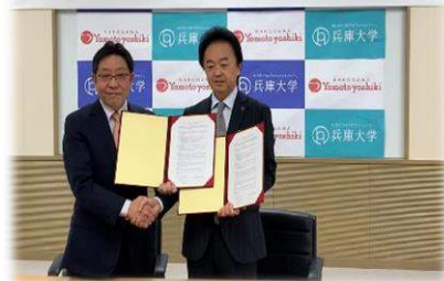
株式会社加古川ヤマトヤシキと兵庫大学・兵庫大学短期大学部の連携協定締結式

2019年12月10日，Yamatoyashiki和兵庫大学、兵庫大学短期大学部，为了振兴地方经济，并实现互相发展，签署了联手合作协议。今后将依靠相互拥有的资源开展交流，推进在各个领域的联手合作。