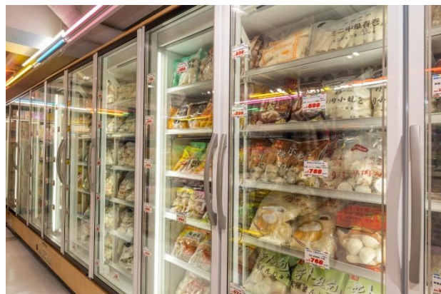
冷冻食品有约 200 个种类 台湾夜市的香肠和泰国的香料也一应俱全