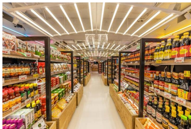
对再现地道·正宗的味道不可或缺的 亚洲调味料有约 240 余种