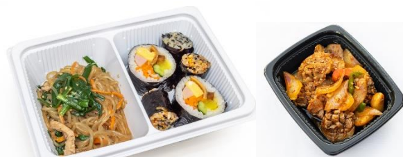
新大久保的人气韩国料理·延边家庭料理店「金达莱」 的熟食。每天约有 15 种类在本店独家供应