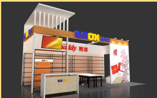
ブースのデザインイメージ