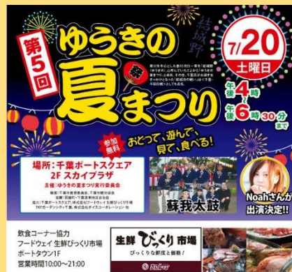
第5回 ゆうきの夏祭り