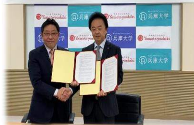
株式会社加古川ヤマトヤシキと兵庫大学・兵庫大学短期大学部 連携協定締結式

2019年12月10日、ヤマトヤシキと兵庫大学・兵庫大学短期大学部は地域の振興と相互の発展を目指し、連携協定を行いました。今後は、互いの資源に基づく交流を行い、様々な分野における連携協力を行っていきます。